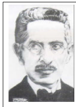
Primer Presidente del BCB Daniel Sánchez Bustamante (1928-1930)